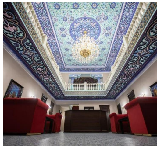
“The shahar” mehmonxonasi

Toshkent, Samarqand, Buxoro shaharlarida barpo etilayotgan kam sig'imli, 2-3 yulduzli mehmonxonalarining aksariyati xususiy sektorlarga qarashlidir. Ularning bir qancha qulayliklari bor: