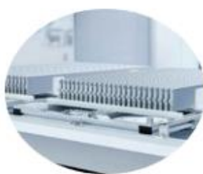
Batareya (litiy, nikel, kobalt)