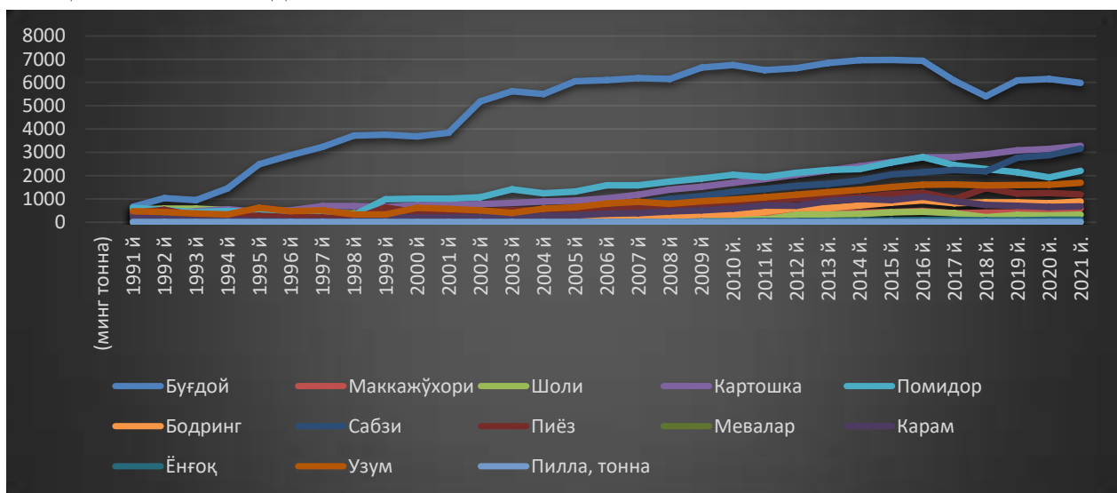
1-расм. 2000-2022 йилларда қишлоқ хўжалик маҳсулотлари етиштириш динамикаси.

чиқарувчиларининг ҳам ички, ҳам ташқи бозорларда рақобатбардошлигини ошириш мақсадида самарали қўллаб-қувватлаш тизимини шакллантириш кераклигини асослаган. Учинчидан, мамлакат миқёсида қишлоқ хўжалигида такрор ишлаб чиқариш жараёнини амалга ошириш учун барқарор имкониятлар яратиш кераклиги таъкид этилган [1]. Бунда, қуйидаги вазифаларни ҳал қилиш лозим: қишлоқ хўжалиги ишлаб чиқаришини режалаштириш ва прогноزلанишнинг илмий асосланган тизимини яратиш, қишлоқ хўжалиги маҳсулотларининг ҳудудий ва озиқ-овқат бозорларини ривожлантириш, қишлоқ хўжалиги маҳсулотларининг савдоси тизимини шакллантириш, қишлоқ хўжалиги ва ресурс ишлаб чиқарувчи тармоқлар ўртасидаги алмашинув эквивалентини ошириш. Ушбу вазифаларни бажаришда қуйидагиларни кўриб чиқиш талаб этилади: