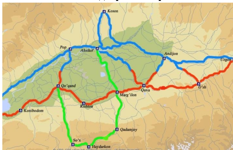
Ахсикент Буюк ипак йўли харитасида.

Ахсикент ёдгорлиги шаҳристон қисмининг шимолий-ғарбий ва шарқий қисмида ҳунармандчилик маҳалласи қолдиқлари ўрганилган. Устахоналар камида икки ёки уч хонадан иборат бўлган. Агар устахона уч хонали бўлса, улардан биринчиси ишлайдиган хона бўлиб, бу ерда ишлаб чиқариш билан боғлиқ асосий ишлар амалга оширилган. Иккинчи-омборхонада хомашё ва тайёр маҳсулотлар сақланган. Учинчи хонада дам олинган, овқатланилган ва зарур бўлганда буюртмалар олинган.