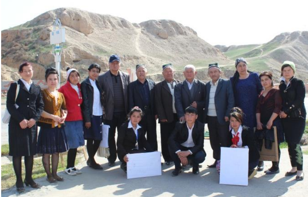
“Тамаддун- 21” ИИЖБ аъзолари Ахсикент ёдгорлигида. 2016 й.