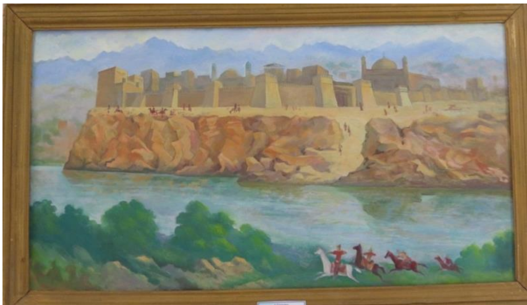
А.Турдалиев. “АХСИКЕНТ ФАРФОНА ШАҲАРЛАРИНИНГ ОНАСИ”. X аср. 75X115. М.,м. 2018 й.