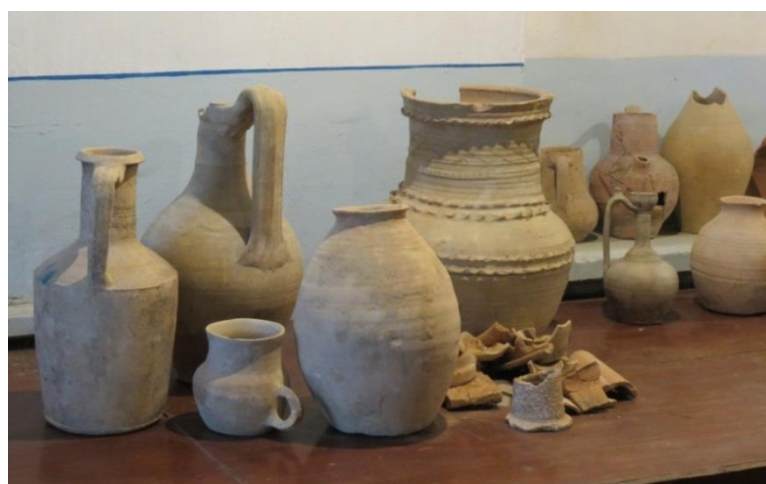
Ахсикентда қазиишма пайтида топилган ноёб топилмалар