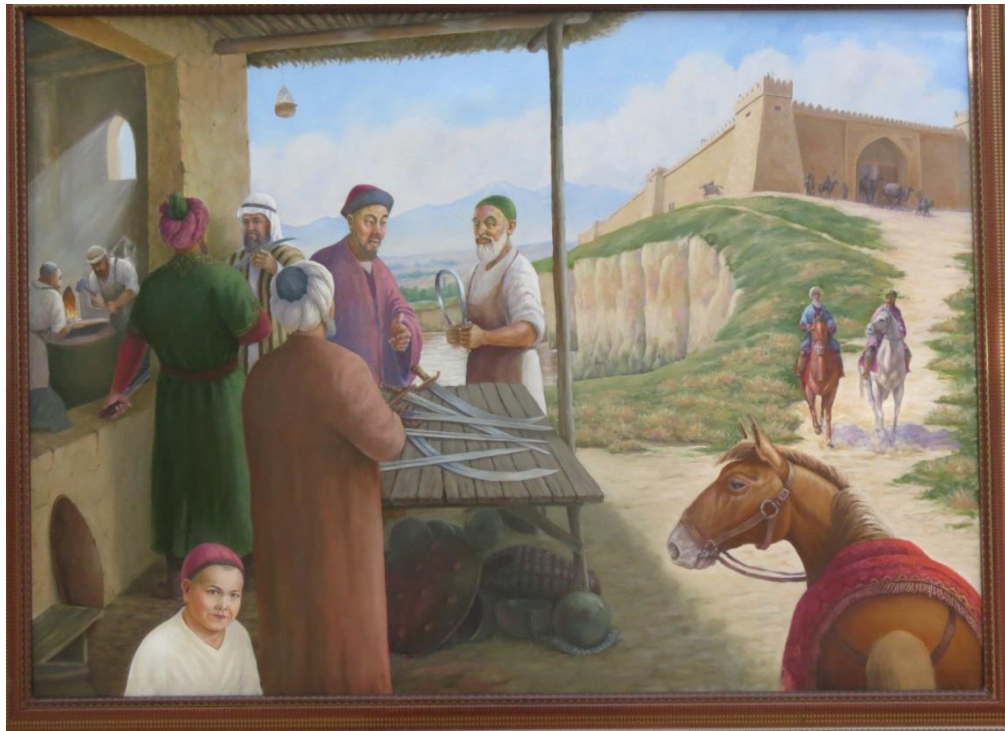
Б.Умаров. “ФАРФОНА –АХСИКЕТ ҚИЛИЧСОЗЛИК УСТАХОНАСИДА.”. 115x160. М.,м. 2018 й.