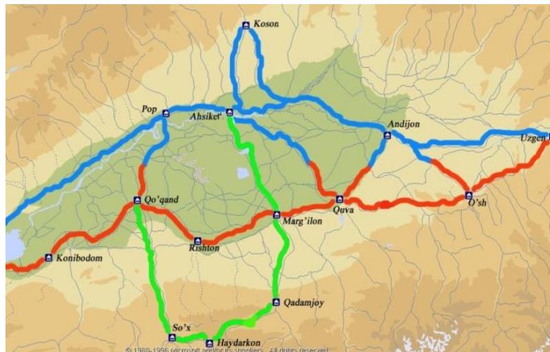
Ахсикент Буюк ипак йўли харитасида.

Ахсикент ёдгорлиги шаҳристон қисмининг шимолий-ғарбий ва шарқий қисмида ҳунармандчилик маҳалласи қолдиқлари ўрганилган. Устахоналар камида икки ёки уч хонадан иборат бўлган. Агар устахона уч хонали бўлса, улардан биринчиси ишлайдиган хона бўлиб, бу ерда ишлаб чиқариш билан боғлиқ асосий ишлар амалга оширилган. Иккинчи-омборхонада хомашё ва тайёр маҳсулотлар сақланган. Учинчи хонада дам олинган, овқатланилган ва зарур бўлганда буюртмалар олинган.