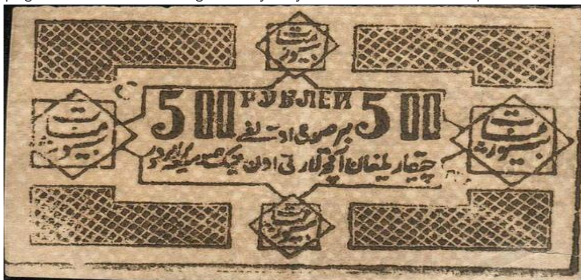
Xorazm XSRning 500 rubl banknotasi (1923-yil)