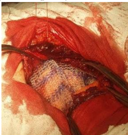
Рис. 3. Фиксация эндопротеза «sublay» к передней брюшной стенке ранее наложенными П-образными швами

Пациентам с количеством баллов от 6 до 10 и с учетом данных КТ с объемом грыжевого выпячивания более 14,1% от объема брюшной полости мы выполняли герниоаллопластику «onlay» без ушивания дефекта с имплантацией эндопротеза П-образными швами 57 больным. С целью увеличения объема брюшной полости, для предупреждения развития САК, после отграничения брюшной полости лоскутом грыжевого мешка, пластика передней брюшной стенки выполнялась наложением сетки на апоневроз без его ушивания. Фиксацию эндопротеза осуществляли П-образными швами заранее наложенными с захватом всех слоёв мышечно-апоневротической стенки до брюшины (рис. 3).