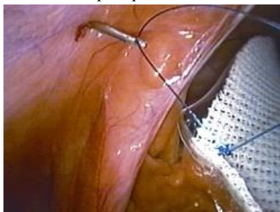
Рис. 2. Выведение шовной нити модифицированной иглой Endo Close (вид со стороны брюшной полости)

Больным до введения имплантата в брюшную полость выполнялось вскрытие брюшины, выделялся грыжевой мешок и в предбрюшинном пространстве создавался «карман», отступ по периметру от грыжевых ворот был 5-6 см. Далее в брюшную полость вводился через троакар, свернутый в тубус сетчатый имплантат, разворачивался и помещался в созданный предбрюшинный «карман». Прижатие его к передней брюшной стенке осуществлялся с помощью лигатур, завязанных по краям имплантата. Подшивание нитью имплантата к передней брюшной стенке производили экстракорпорально с помощью модифицированной нами иглы Endo Close (рис 2).